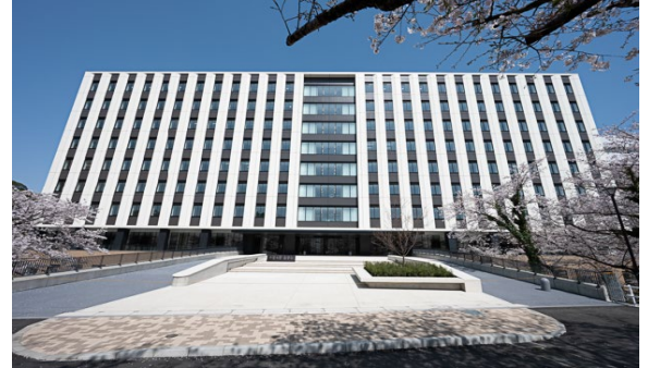
医学系総合研究棟外観（南玄関側）

千葉大学医学部では、難治性の疾患を治癒やQOL改善に導き、患者目線での医療を届けることを目的とした『治療学』研究を目指す研究医と、最新の治療法を高い倫理観と患者さんを思いやる心を持って届けることのできる優れた臨床医の双方の育成を行っています。今まで以上の研究環境を確保することで、基礎医学と臨床医学を基に最先端の基礎研究の成果を新しい治療法の開発に結びつけ、教育研究活動の効率化と飛躍的な発展、および革新的な研究の創出が期待されます。