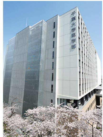
医学系総合研究棟外観（西側）